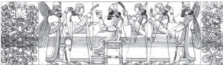
Figura B: Regele bea vin înconjurat de eunuci și protejat de duhuri înaripate bărbătoase și de copaci sacri.

lui mic și la cel al familiei, adoptând altul. Deseori, acest fapt se petrecea în cadrul unei ceremonii complexe, în timpul căreia novicei îi era dăruită o haină nouă, un pumnal și însemne distinctive, cum ar fi perechi de cercei și brățări 36 . Sarcina multora dintre ei era să-și apere suveranul de amenințările exterioare, provenind din mediul înconjurător deopotrivă natural și social. Imaginile pe care le-am văzut ne spun că unii eunuci îl protejau de insecte sau de soare. Altele (vezi fig. 3, grupaj ilustrații color) arată că, îmbrăcați în haine fin brodate, împodobiți cu cercei, un colan și o brățară, îndeplineau și funcții mai delicate, cum ar fi aceea de a purta armele suveranului: un ciomag, un arc, o tolbă plină cu săgeți și o sabie. Alții verificau mâncarea pregătită pentru rege, așa cum se întâmpla și la curțile altor imperii unde: